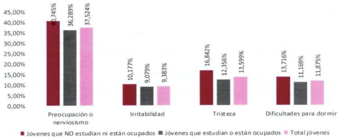
Gráfica 3. Porcentaje de personas de 14 a 28 años, según sentimientos que ha experimentado Total 23 ciudades. Julio 2020 – julio 2021